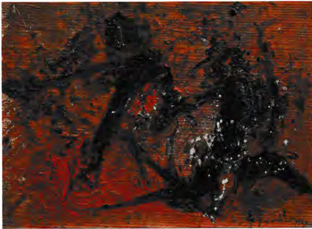
《無題》1960年 千代田工芸株式会社寄贈